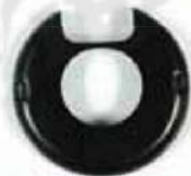
МОДИФІКОВАНА КРИШКА ЦІВКИ